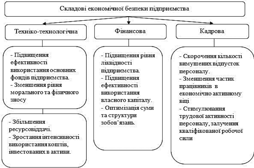
Рис. 2. Основні шляхи запобігання загрозам економічній безпеці підприємства

До інших зовнішніх загроз можна віднести: рівень інфляції, брак коштів для інвестування підприємства, законодавча нестабільність, корупція, несприятливі макроекономічні умови (криза, війна, загальноекономічна ситуація в країні). Основні шляхи запобігання загрозам економічній безпеці підприємства наведено на рис. 2.