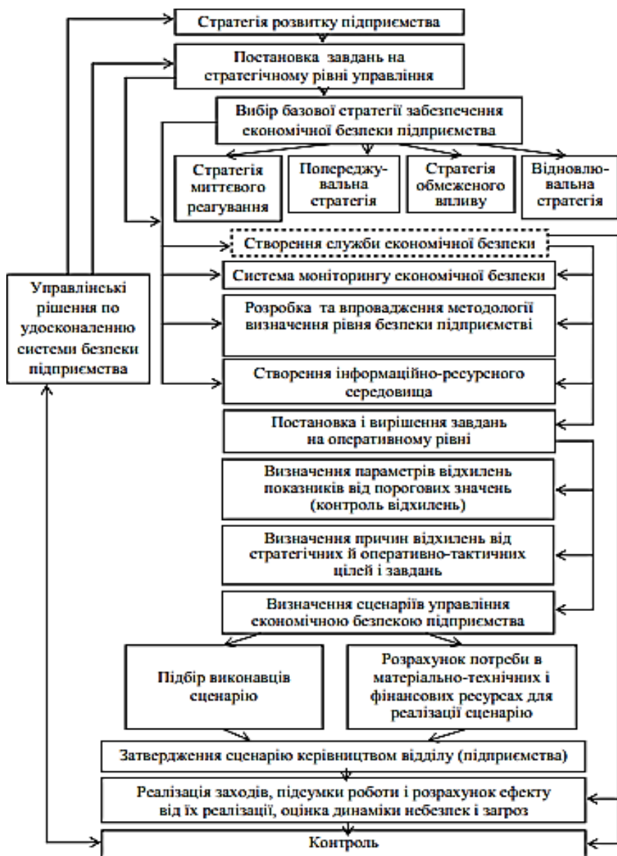
Рис. 3. Схема функціонування механізму управління в системі економічної безпеки підприємства