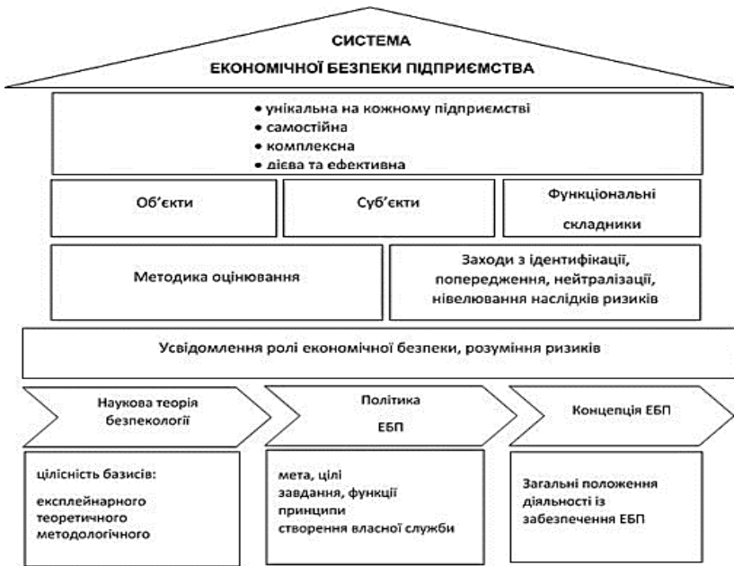
Рис. 1. Трактування системи економічної безпеки підприємства

суб'єктів і способів їх захисту, зв'язки та відносини між якими визначаються виконуваними системою функціями та режимом функціонування системи.